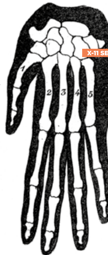
X-11 SEP LAS MANOS DE LOS PRIMATES

Si quieres conocer cómo ha ido evolucionado la anatomía de nuestras manos no dejes de ver esta conexión.