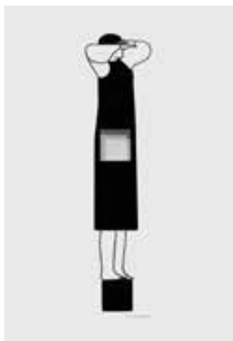
ilustración de portada: