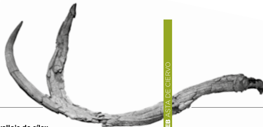
X-14 FEB ASTA DE CIERVO

En el árbol de la evolución humana encontramos varios géneros y especies de homínidos diferentes. Uno de los más desconocidos es el Kenyanthropus platyops . Conozcamos más en profundidad a esta especie que vivió en África hace más de 3 millones de años.