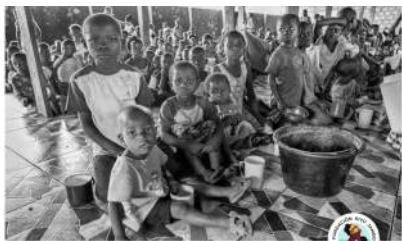
FOTOGRAFÍAS DE EDUARDO MARGARETO PRODUCCIÓN FUNDACIÓN KIVU JAMBO-PROYECTO RUBARE

lleva años trabajando en este territorio. Rubare, Goma, Bukavu y la isla de Idjwi son los escenarios que conforman esta exposición. Un recorrido visual por las entrañas de un territorio marcado por la precariedad, pero también por la resistencia cotidiana de quienes lo habitan. Entrada libre.